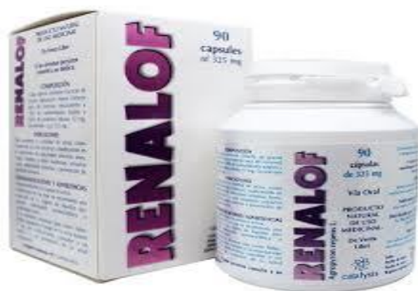
Ilustración 1. Productos cosméticos