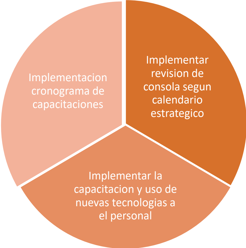
Figura 3. Estrategia a realizar