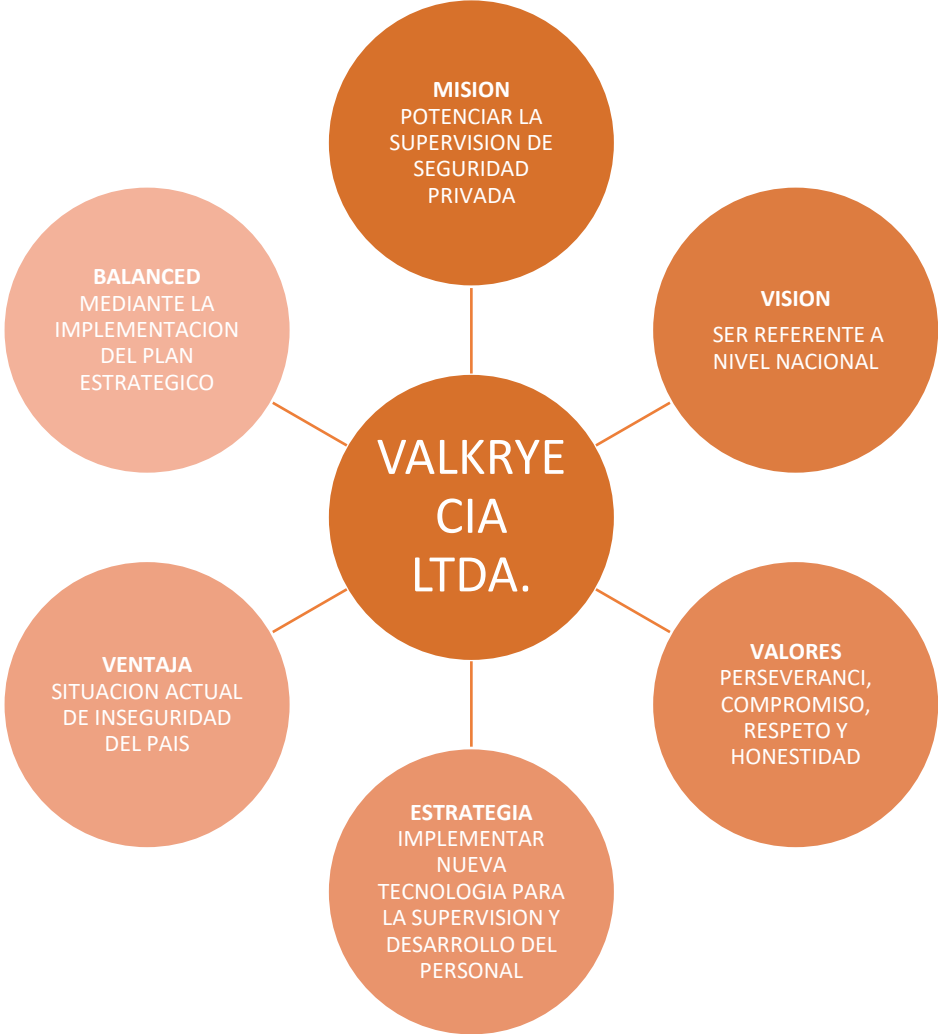
Figura 2. Declarar estrategia

Una vez analizados los diferentes factores, se elabora un plan detallado para alcanzar los objetivos establecidos por VALKRYE CIA LTDA. La implementación y monitoreo continuo de esta estrategia permitirán evaluar los resultados del programa en un período de unos meses.