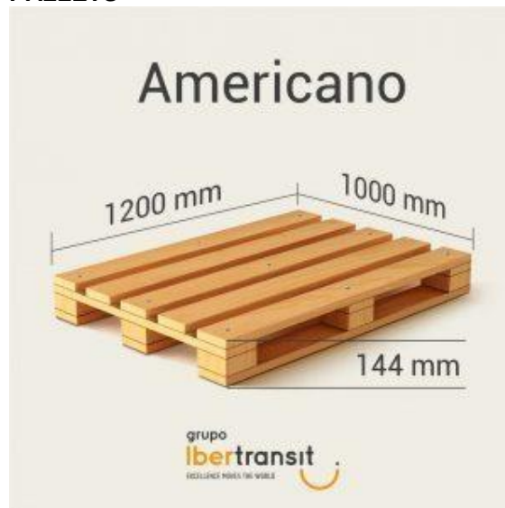
Ilustración 3 PALLETS

Los pictogramas y simbologías en una caja para exportar son representaciones gráficas que se utilizan para transmitir información importante y relevante sobre el contenido del embalaje, las características del producto y las instrucciones de manejo. Estos símbolos son esenciales para garantizar la seguridad durante el transporte, el manejo adecuado de la mercancía y el cumplimiento de las regulaciones internacionales. (Guerra, 2023)