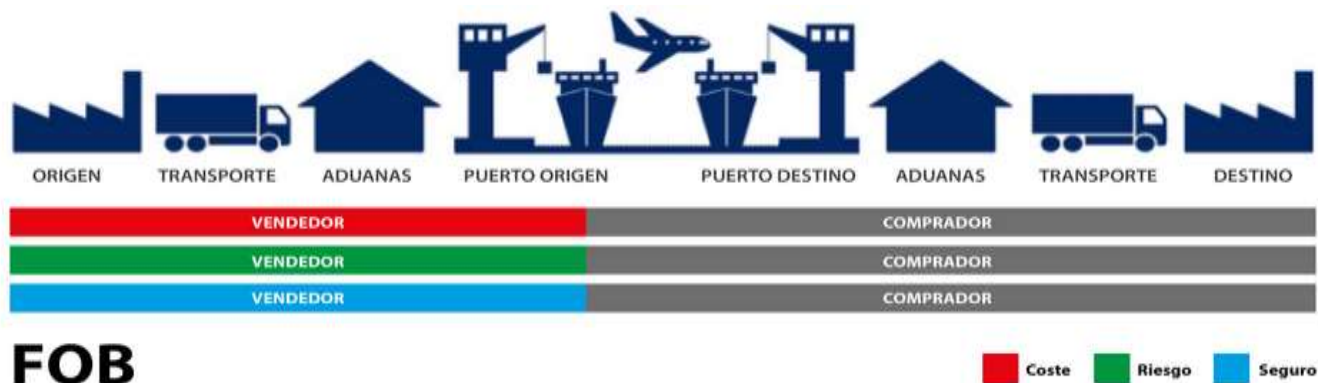
Imagen descriptiva del incoterm FOB.

Fuente (Partida Logistics, 2024) Elaborador por: Macías, J. (2024).