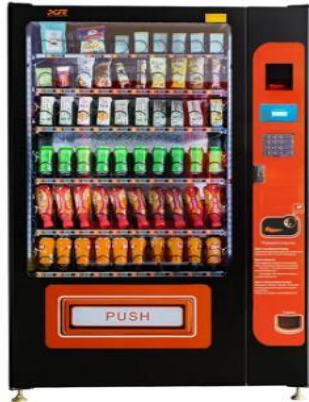
Figura 1 máquina expendedora