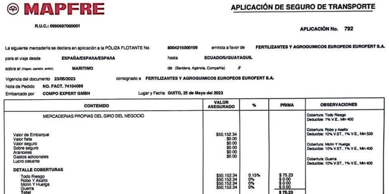
Ilustración 4 : Póliza de seguro

La misma debe constar en valor monetario el valor completo de la mercancía o puede ser mas de lo valorado, eso ya es cuestión de como lo maneje los conocidos brokers de seguro, así mismo si no desea poder contratar una póliza puede aplicar el 1% del Valor Fob, siempre y cuando el importador se responsabilice que si en caso de algún siniestro perderá por completo la carga y no podrá recuperar una parte de la misma.