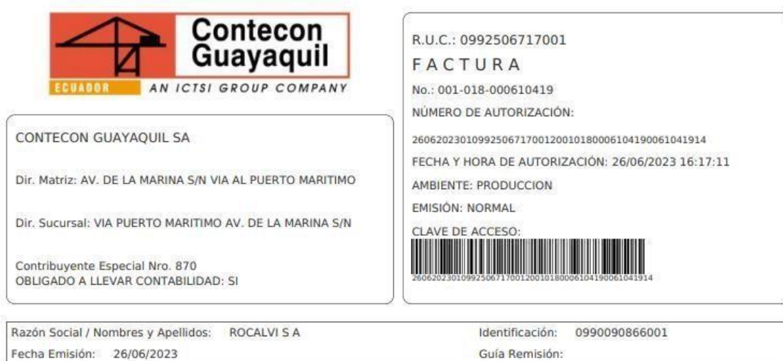
Ilustración 8: Factura por almacenaje

Finalmente, una vez coordinado lo que sería la salida de la mercancía del depósito que se encuentre el mismo deposito le generara una factura por el almacenaje de la mercancía, es decir, un valor a pagar que se genera por los días que se encuentra la carga dentro del almacén, para esta importación el depósito es CONTECON y ellos nos proporcionaron la Factura ya que contábamos con crédito, logrando así que el proceso o coordinación sea más rápido.