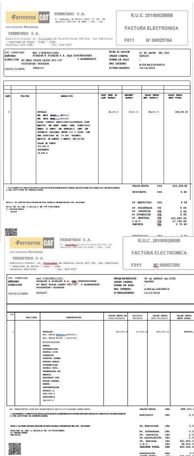
Gráfico 1 Factura Electrónica

Fuente Ferreyros CAT Elaborado por: Tomalá, D. (2023)