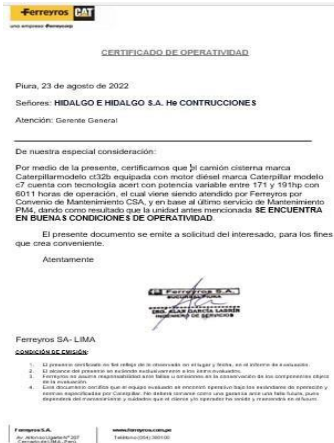
Gráfico 6 Certificado de Operatividad

Fuente: Ferreyros Elaborado por: Tomalá, D. (2023)