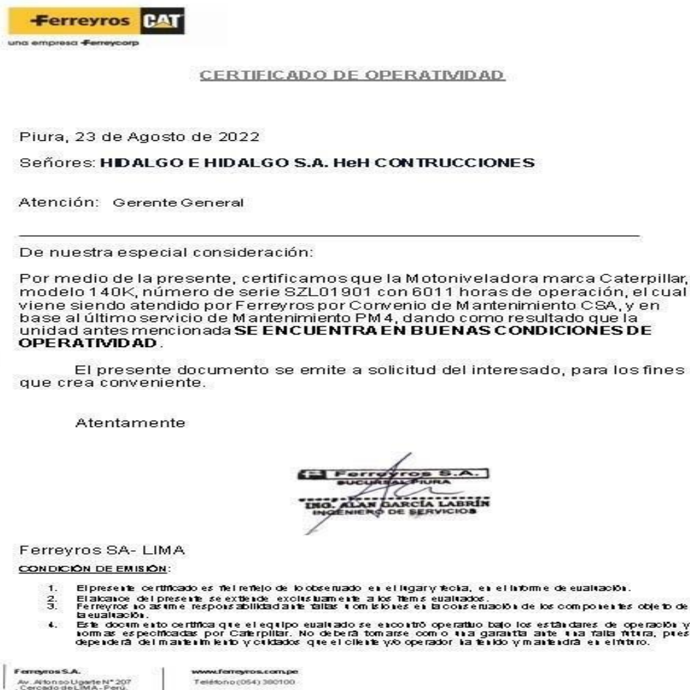
Gráfico 5 Certificado de Operatividad

Fuente: Ferreyros Elaborado por: Tomalá, D. (2023)