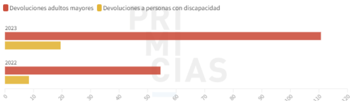
Beneficiarios de la devolución del IVA – Periodo 2022-2023