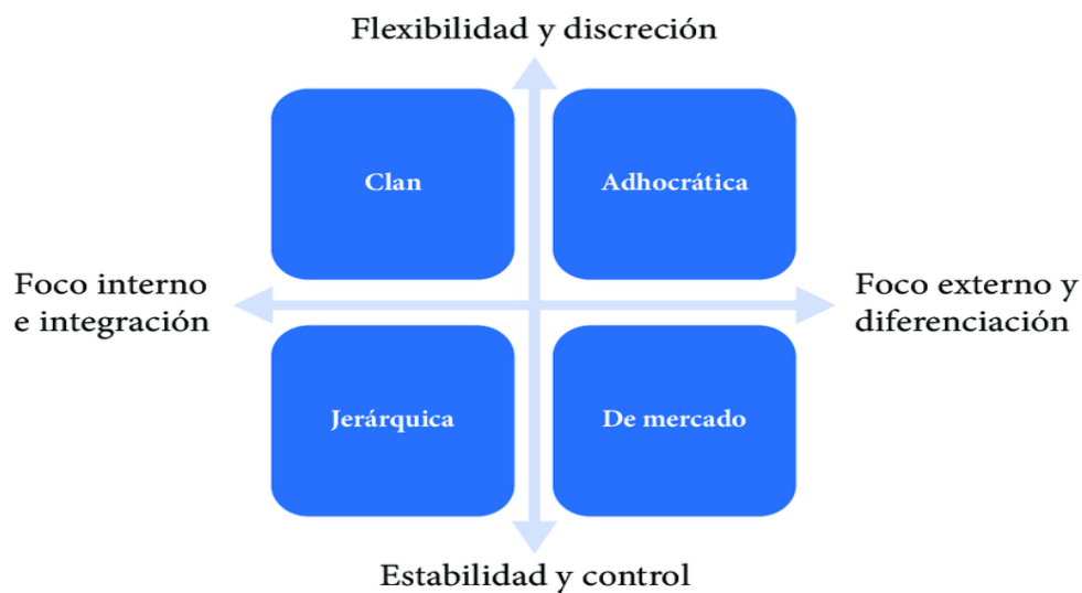
Modelos de tipos de cultura Organizacional de Cameron y Queen

Fuente: (Vesga & García, 2020) Elaborado por: Cheme (2023)