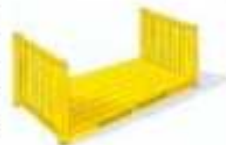
Figura 4. Tipo de contenedores