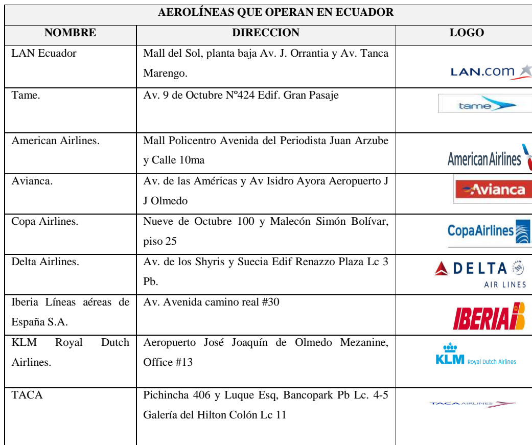
Tabla 2: Listado de aerolíneas que operan en el Ecuador.

mercancía en base al peso de ésta, y si no llegamos, lo haremos en base al “peso volumen” .