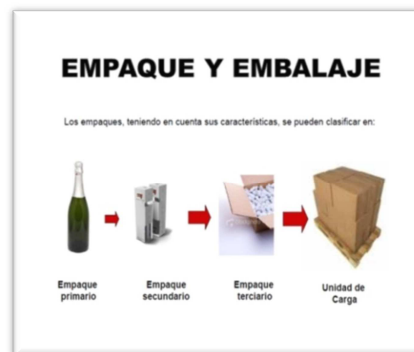
Figura 2. Empaque y embalaje

El manual de empaque y embalaje de Sergio Torres describe al empaque como “Las actividades de diseñar y producir el recipiente o la envoltura para un producto” en razón de lo cual se puede establecer varias clases de empaque que se detallan a continuación: