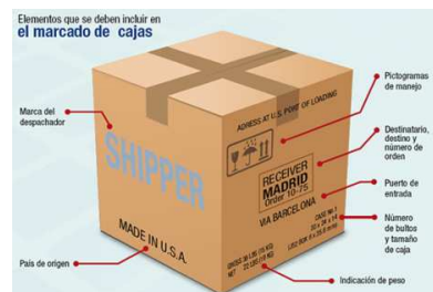
Figura 3. Embalaje

De tal manera que el producto mantenga su impermeabilidad, higiene, adherencia, etc. Además de informar sobre sus condiciones de manejo, requisitos legales, composición, ingredientes, etc.