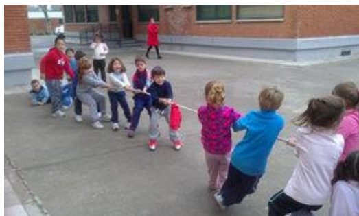
Figura 9. Hala y gana