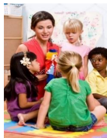
Figura 3. El títere preguntón