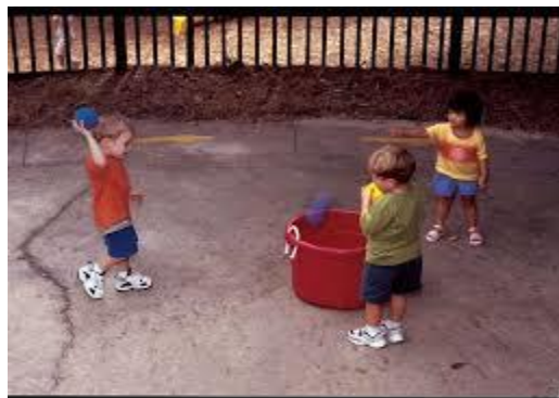
Figura 10. Lluvia de pelotas