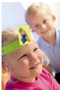
Figura 4. Quien soy