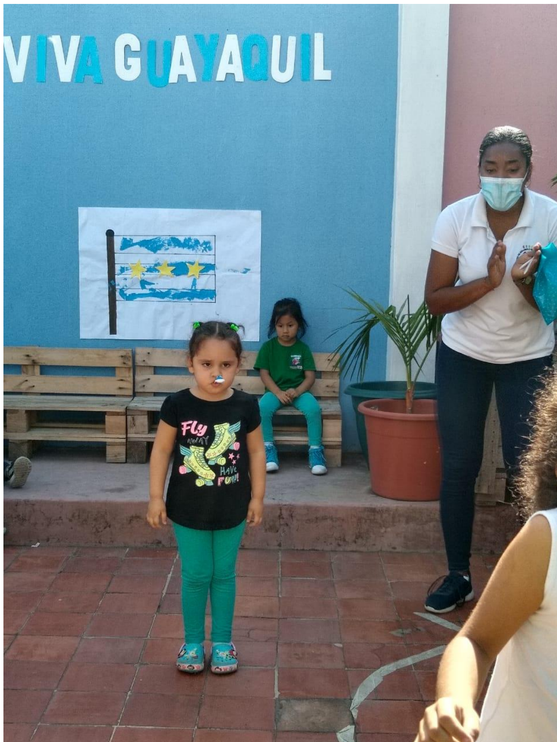
Anexo 4. Foto de la aplicación de ficha de observación docente