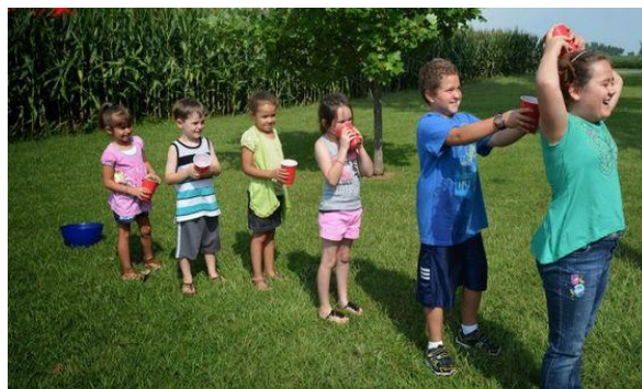
Figura 12. Todos atentos.