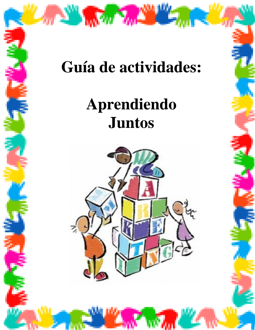
Figura 2. Aprendiendo juntos: Guía de actividades para docentes de niños de 4 a 5 años