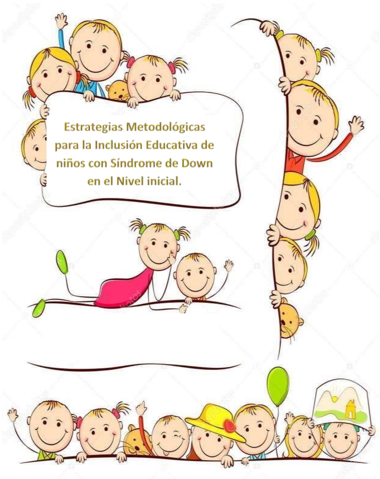
Figura 2 Carátula de la propuesta Elaborado por (Osorio S, 2021)