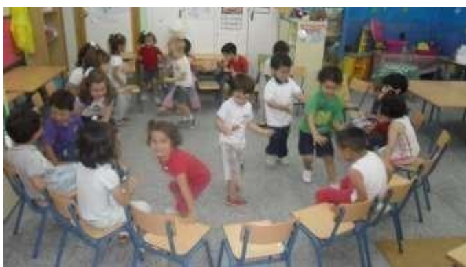
Figura 3 Juegos grupales en círculos Tomado de: Todos a jugar (Bloggers) Elaborado por (Osorio S, 2021)