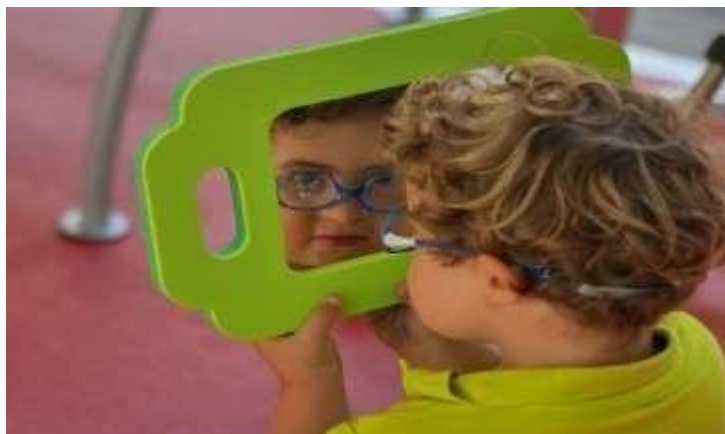
Figura 4 El niño en el Espejo