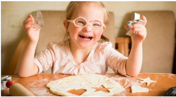
Figura 10 Amaso, armo figuras y formas