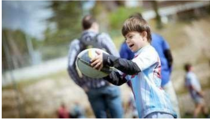
Figura 5 Juegos para niños Down Tomado de Juguetes para niños con Síndrome de Down. (Arco Iris Blog) Elaborado por (Osorio S, 2021)