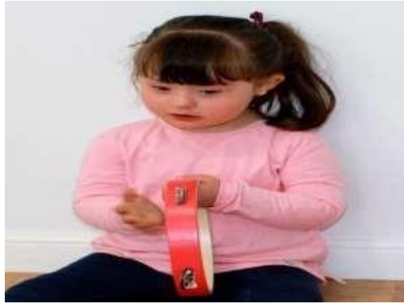
Figura 8 Aprendo con música

Destreza a ser desarrollada: Cantar canciones siguiendo el ritmo y coordinando con las expresiones de su cuerpo