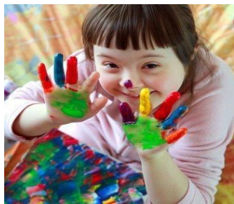
Figura 9 Dactilopintura, aprendo y siento Tomado de: Guía Infantil Elaborado por (Osorio S, 2021)