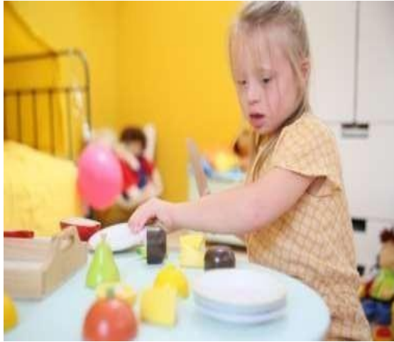
Figura 6 Conteo de elementos y asociación Tomado de: Down: 10 consejos para facilitar el aprendizaje. (Blog) Elaborado por (Osorio S, 2021)

Destreza a ser desarrollada: Establecer la relación de correspondencia entre los elementos de colecciones de objetos.