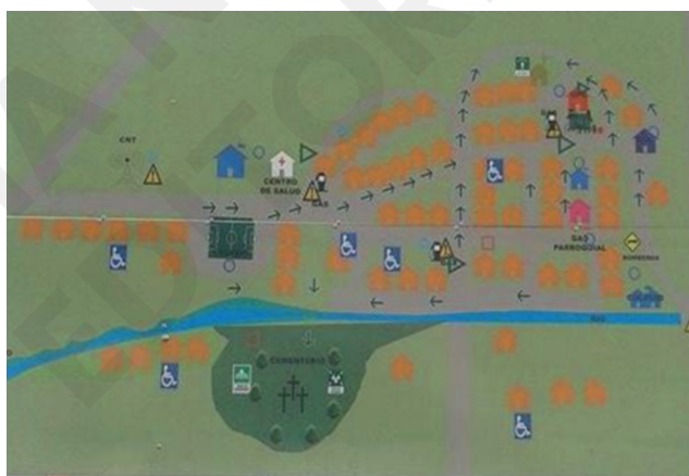
Figura 10. Plano de Progreso.

La débil economía local ocasiona que muchos de los pobladores trabajen fuera de la parroquia, por ejemplo en Posorja, General Villamil Playas, El Morro y Guayaquil en el pasado, numerosos pobladores dependían del importante flujo vehicular en tránsito hacia las poblaciones costaneras (ver figura 10).