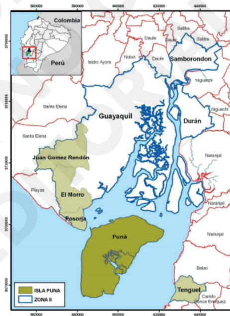
Figura 1. Ubicación de la Isla Puná.

Puná es una isla del cantón Guayaquil en Ecuador, forma parte de la provincia de Guayas. Según el Censo de Población y Vivienda del 2010, su población es de 6.769 personas en, su extensión es de 919 km 2 y está situada en el golfo de Guayaquil, frente a la formación deltaica del estero salado y del río Guayas, es la tercera isla más grande del país tras la isla Isabela e isla Santa Cruz en las Galápagos (ver figura 1). Ubicada en la misma embocadura del golfo, entre la punta del Morro y la costa de la provincia de El Oro. Está separada de tierra firme por el canal de Jambelí al sureste, y por el estrecho canal del Morro, al noroeste (Instituto Nacional de Estadísticas y Censos, INEC, 2010).