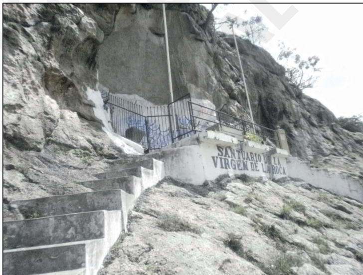
Figura 6. Fotografía del ingreso al Santuario Virgen de La Roca.