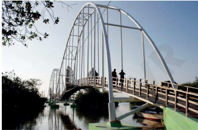
Figura 2. Fotografía del puente de Bellavista, tomada en visita in situ.

la isla que ofrecen platos típicos en base a productos de la zona, como: chivo, camarón, lisa, concha; combinados con frutas exóticas como la chirimoya, coco, pitahaya y una de sus bebidas tradicionales la tumba chola creada a base del coco. Los precios de los platos fluctúan entre tres a cinco dólares.