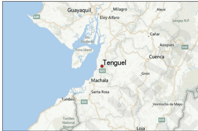
Figura 12. Ubicación de la parroquia Tenguel.