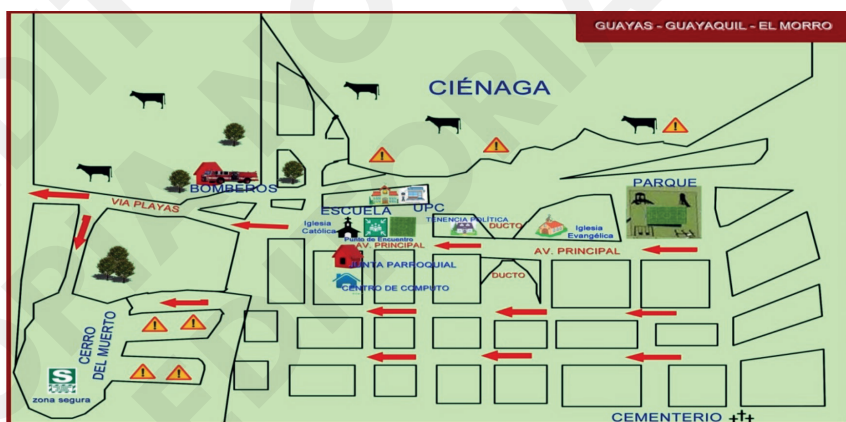
Figura 7. Plano turístico de El Morro.

Siguiendo la dirección hacia el océano Pacífico encontramos el principal atractivo de esta parroquia, Puerto El Morro. Por lo que más se conoce este sector es por el avistamiento de los delfines grises o Nariz de Botella que están presentes todo el año. Puerto El Morro es un área con atractivos naturales que muchas personas desconocen, como su extenso estero y el manglar adyacente con su diversidad biológica dentro de los que resaltan