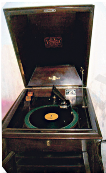
Figura 15. Fotografía de la vitrola que se conserva en la casa-museo de la parroquia Tenguel.

Quien se pasea por Tenguel, ubicado a 7 km de la vía Guayaquil-Machala, no puede abstraerse de su arquitectura. Las estructuras de las casas, una equilibrada mezcla de madera y cemento, son el recuerdo más visible del paso de la United Standard Fruit y por falta de recursos no se ha logrado preservar las antiguas edificaciones.