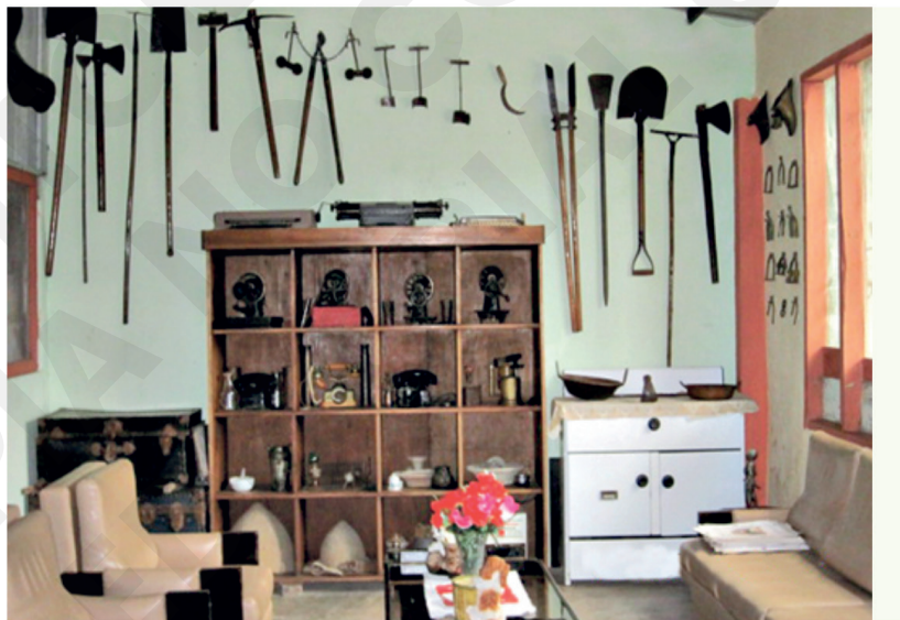
Figura 14. Fotografía de la casa-museo de la parroquia Tenguel, donde se consevan las reliquias de esta zona.

Gracias a la iniciativa privada, la parroquia cuenta con un museo en una vivienda particular (figura 14), donde se puede ubicar una gran cantidad de piezas históricas que van desde una locomotora, hasta una vitrola de hace más de cien años (figura 15), las cuales tienen vestigios de golpes sufridos y documentan la evidencia de los bombardeos sufridos por la parroquia en al año 1941 en la guerra con el vecino país del sur.