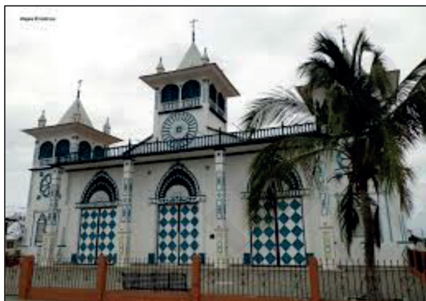
Figura 8. Iglesia San Jacinto de El Morro.