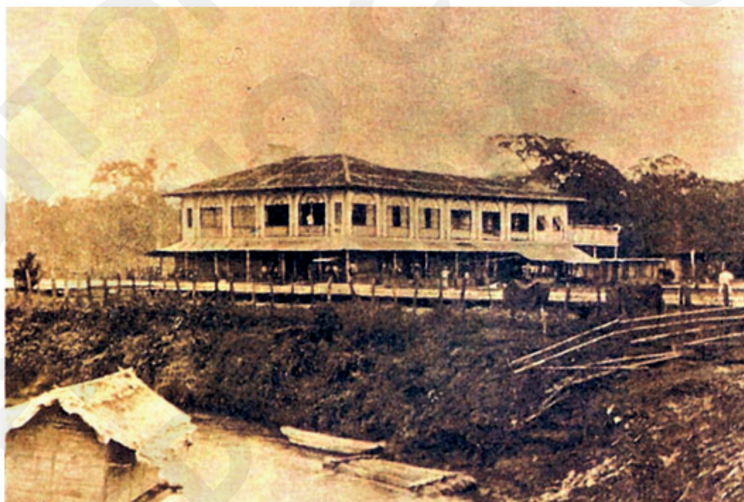
Figura 13. Fotografía de las instalaciones de la United Standard Fruit en 1934.

En la figura 13 se pueden observar las instalaciones de la empresa United Standard Fruit que se asentó en tierras de Tenguel, que pertenecían a una antigua hacienda de los Stagg, en 1934.