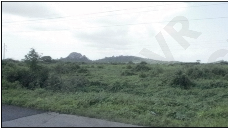
Figura 5. Fotografía del Cerro de El Muerto al ingreso a El Morro.