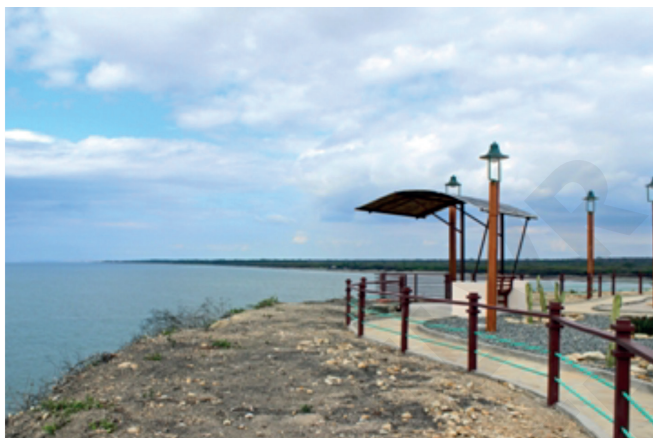
Figura 3. Fotografía del mirador de Subida Alta.

llegan de todas partes de Guayaquil y la provincia. Este es una oportunidad extraordinaria para los habitantes de Puná Nueva, porque pueden mostrar su producto estrella, la chirimoya , la misma que tiene varios tipos, colores y tamaños, teniendo el jurado invitado una difícil labor en la elección del mejor fruto, elección que trae de la mano las motivaciones para que los emprendedores promuevan proyectos de exportación de la fruta.