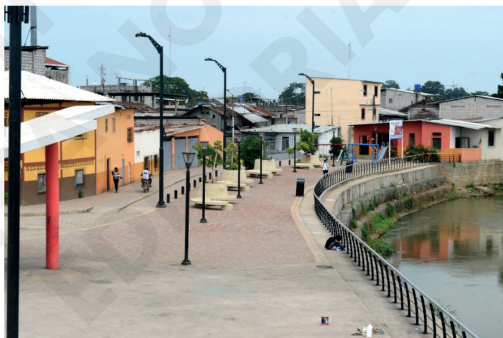
Figura 11. Fotografía del malecón de Tenguel.

La parroquia Tenguel era un pequeño campamento de unas pocas casas rústicas usualmente construidas en caña con estructura de chonta y techo de bijao. Las familias que habitaban Tenguel eran los Macías, Sarmiento,