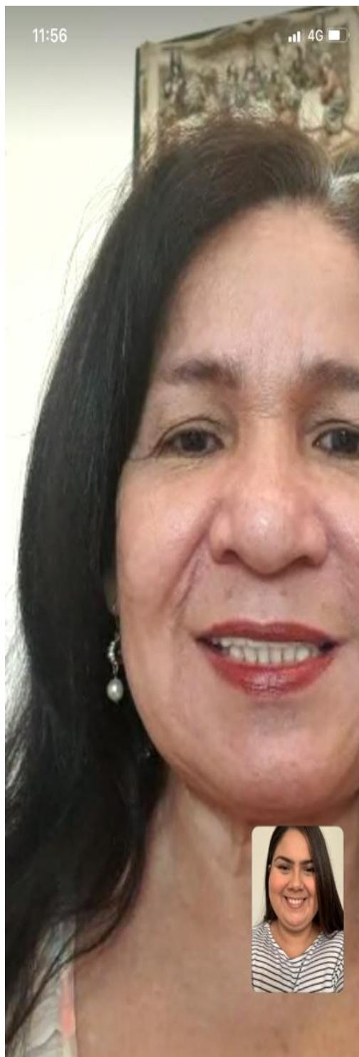
Entrevista elaborada el 12 de agosto del 2020, vía WhatsApp.