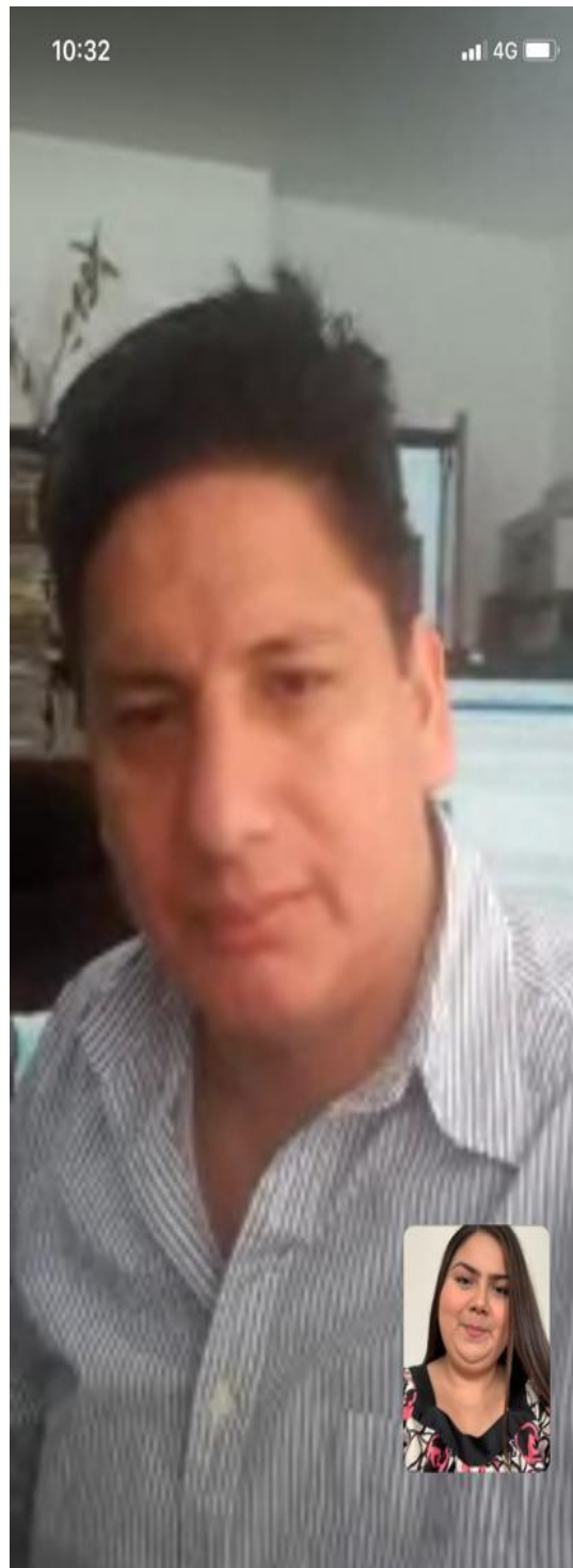
Entrevista elaborada el 17 de Julio del 2020, vía WhatsApp.