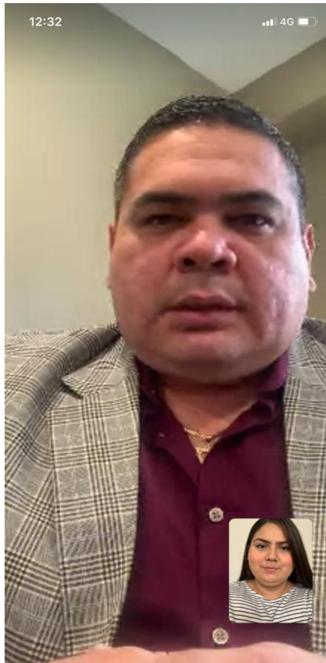
Entrevista elaborada el 8 de Julio del 2020, vía WhatsApp.