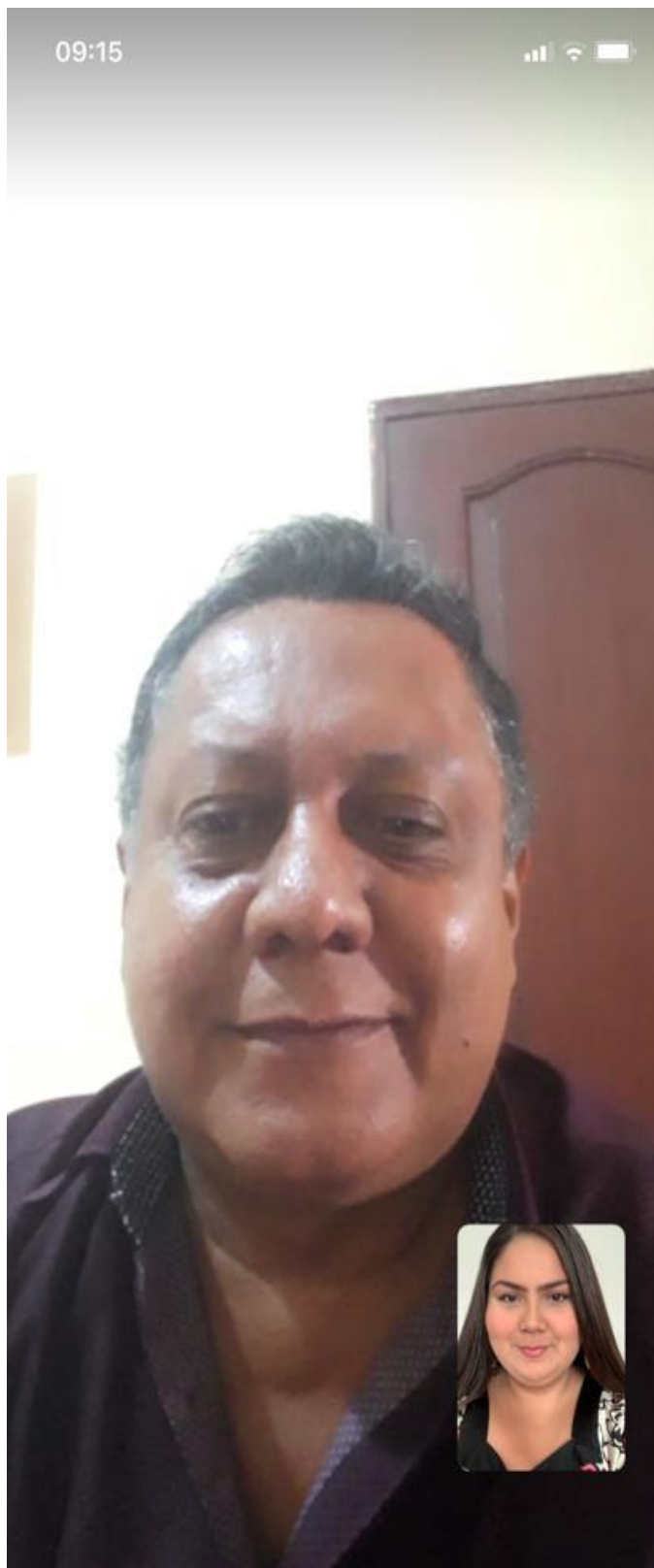
Entrevista elaborada el 29 de Julio del 2020, vía WhatsApp.