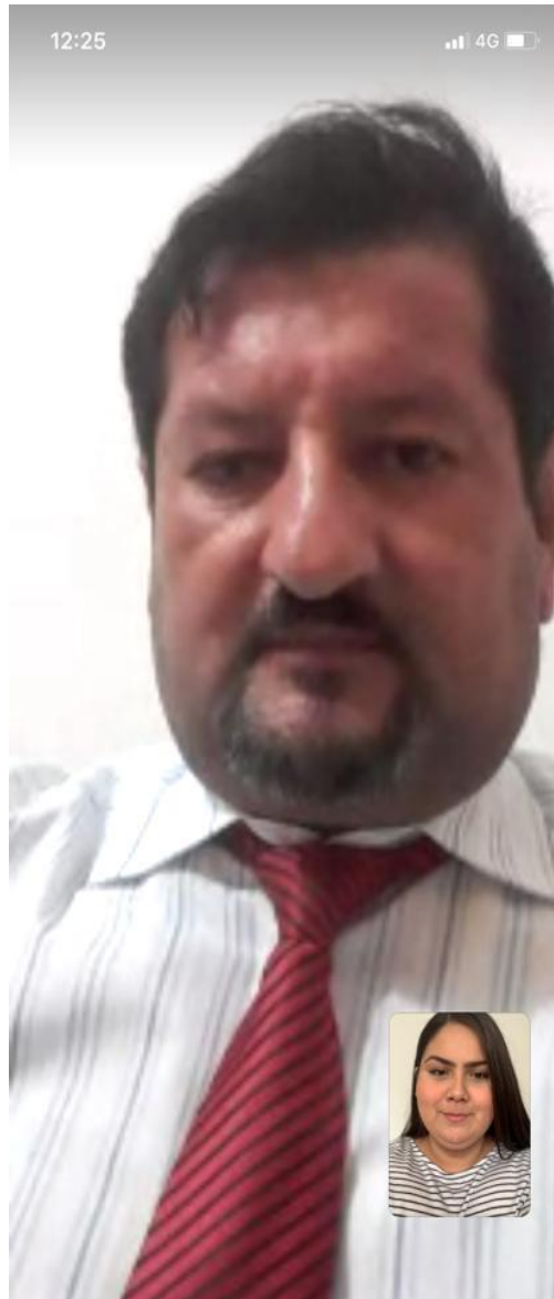
Entrevista elaborada el 22 de agosto del 2020, vía WhatsApp.