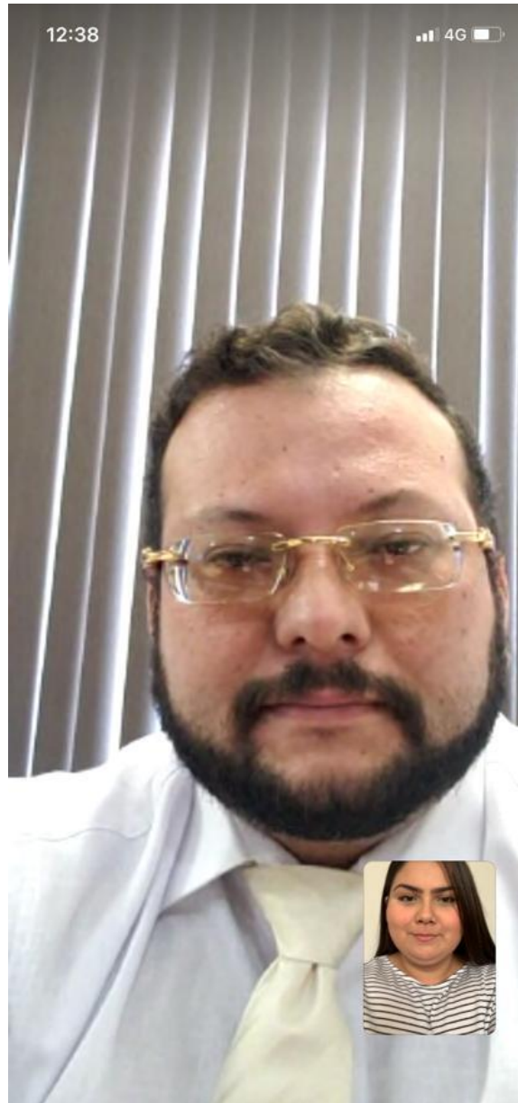
Entrevista elaborada el 13 de Julio del 2020, vía WhatsApp.