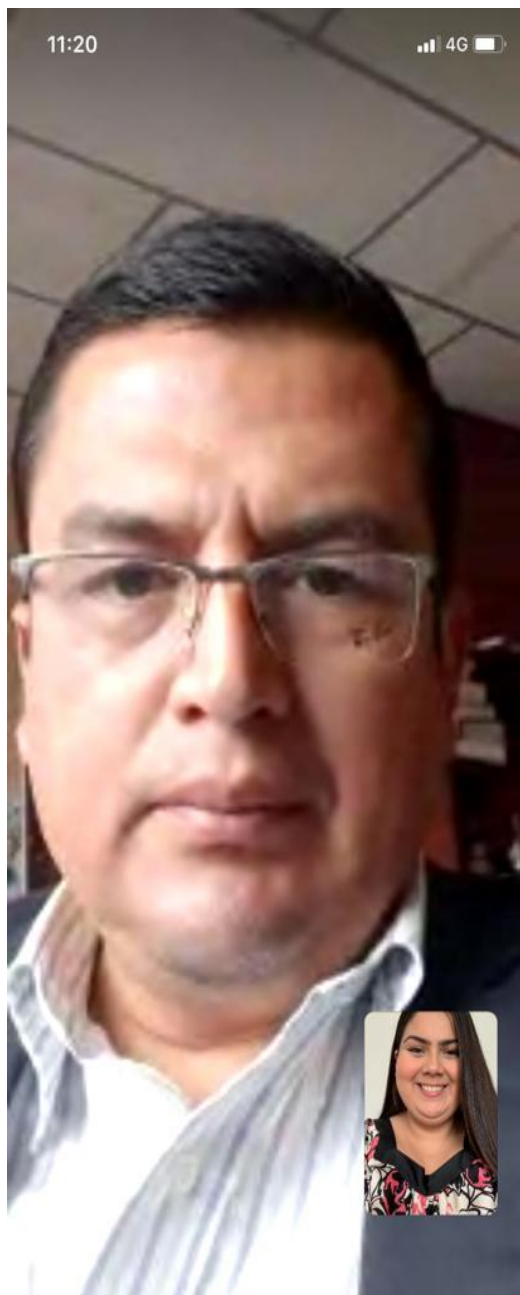
Entrevista elaborada el 23 de Julio del 2020, vía WhatsApp.