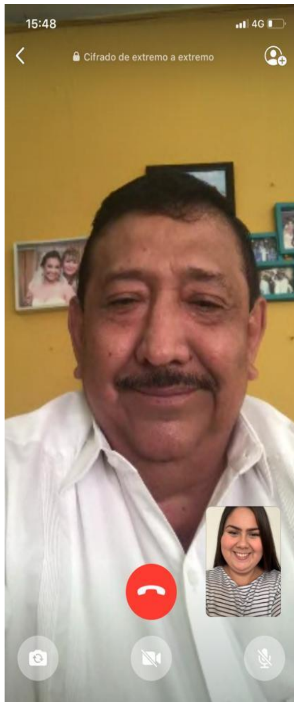
Entrevista elaborada el 20 de Julio del 2020, vía WhatsApp.